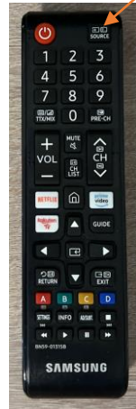
3. Press source button