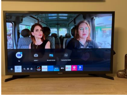
2. If this screen comes up You are on android so continue To 3. if not and you see the screen On number 5., please continue from That point