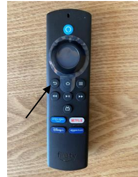
13. To go back to the programme list, press the back button then repeat