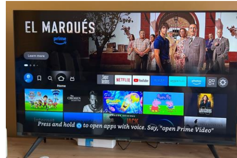
5. You will see this screen