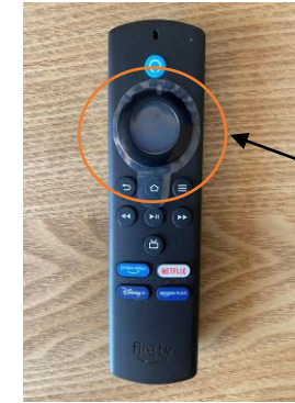
6. Using this remote, the circular area of the remote (outer for Up, down, left right) and Inner for select