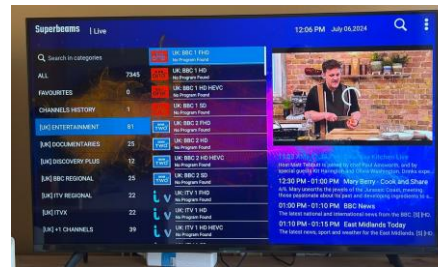
11. The image of the programme will appear on the right hand side like this. To make this to the entire screen, just press the programme (in the centre) again.