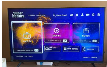
9. You will want to select "Live TV"