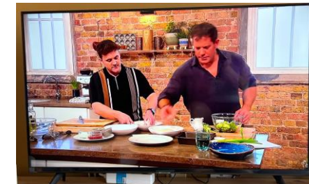
12. You will then see the programme on the full screen