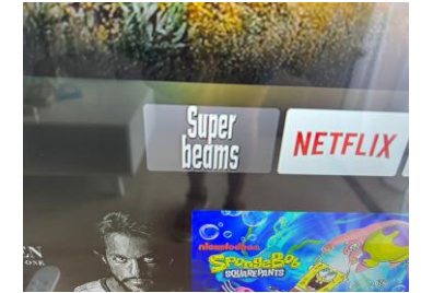
7. Select Super Beams