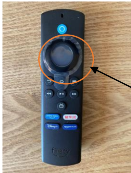
8. Again, Using the circular area Of the remote (outer for Up, down, left right) and Inner for select