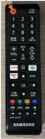
1. Turn on TV